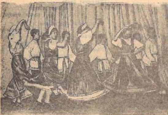
Русский танец.

Народные материалы фестиваля будут опубликованы в следующих номерах нашей газеты.