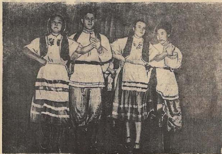
На снимке: группа студентов исполняет молдавский танец «Молдавская».