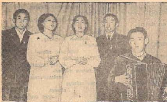
Поют русскую народную песню «Летят гуси вереницей».