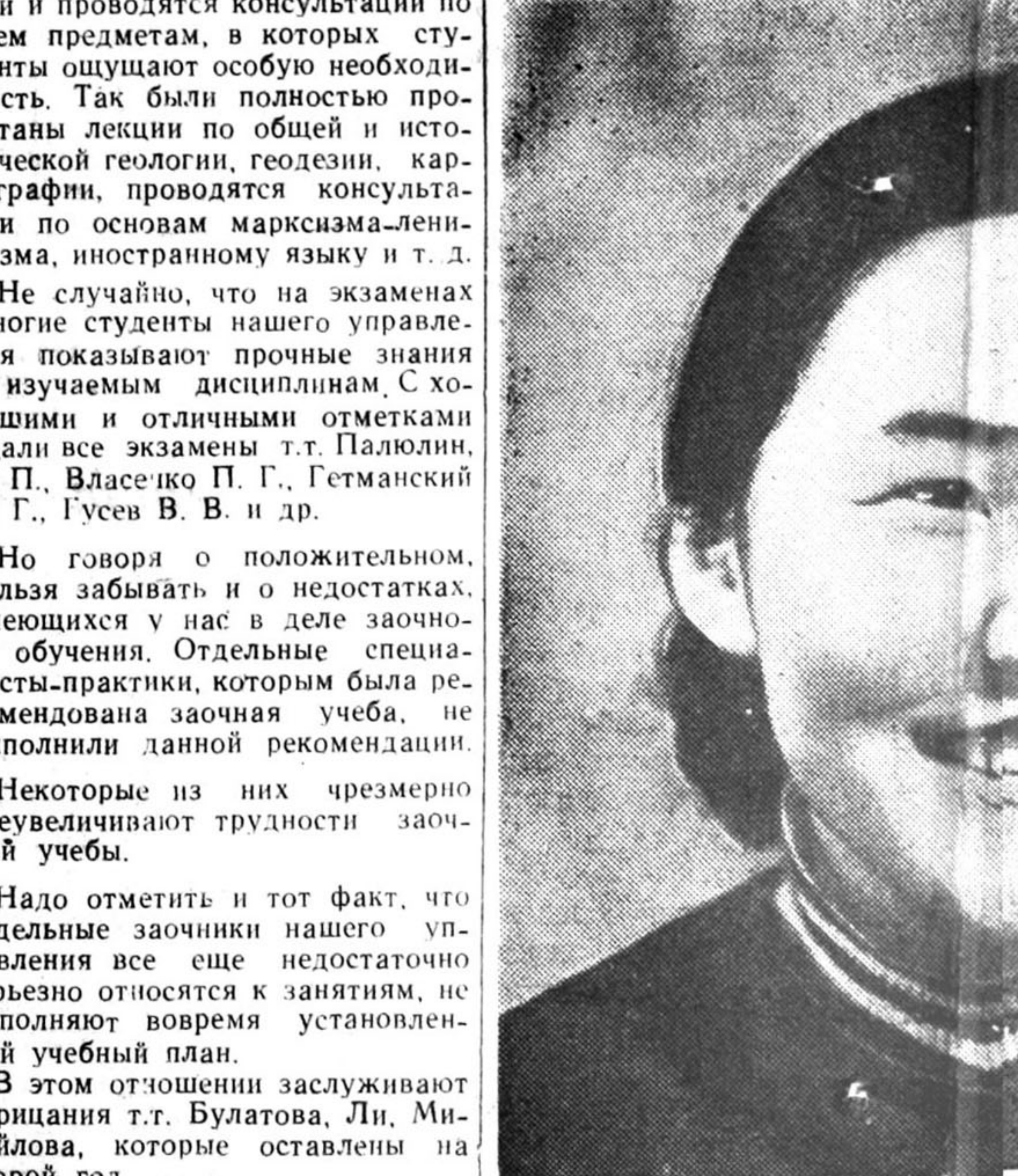
На фотоконкурс. Студентка — якутка.

улучшение и расширение вечернего и заочных вузов, развития сети вечерних вузов, организации вечерней и заочной при крупных промышленных и сельскохозяй-