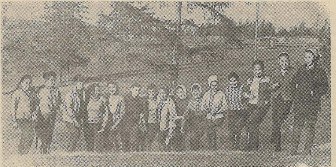
НА СНИМКЕ: студентки медицинского факультета.

Зав. кафедрой терапии и клинической диагностики, профессор: