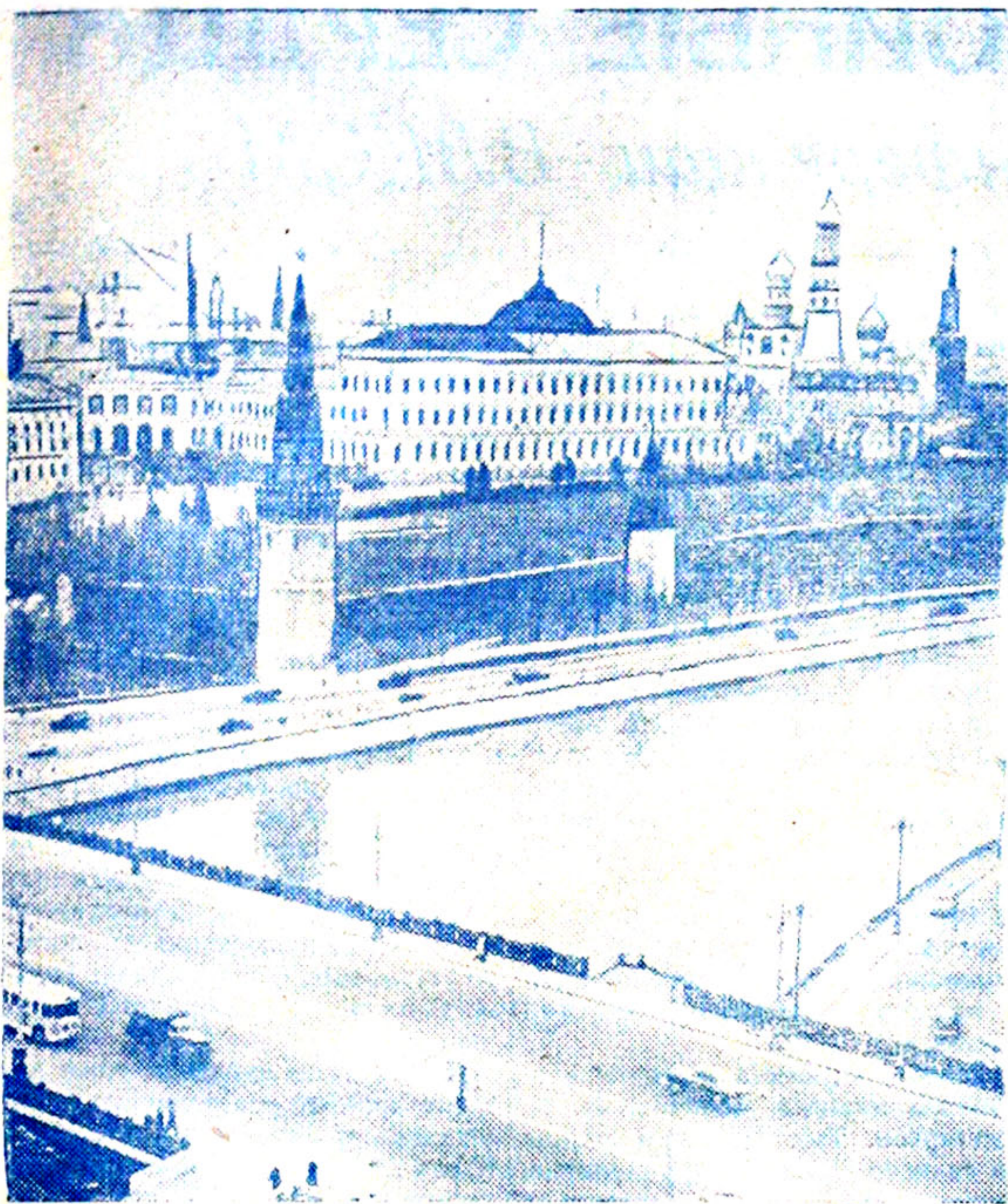
Москва. Вид на Кремль.