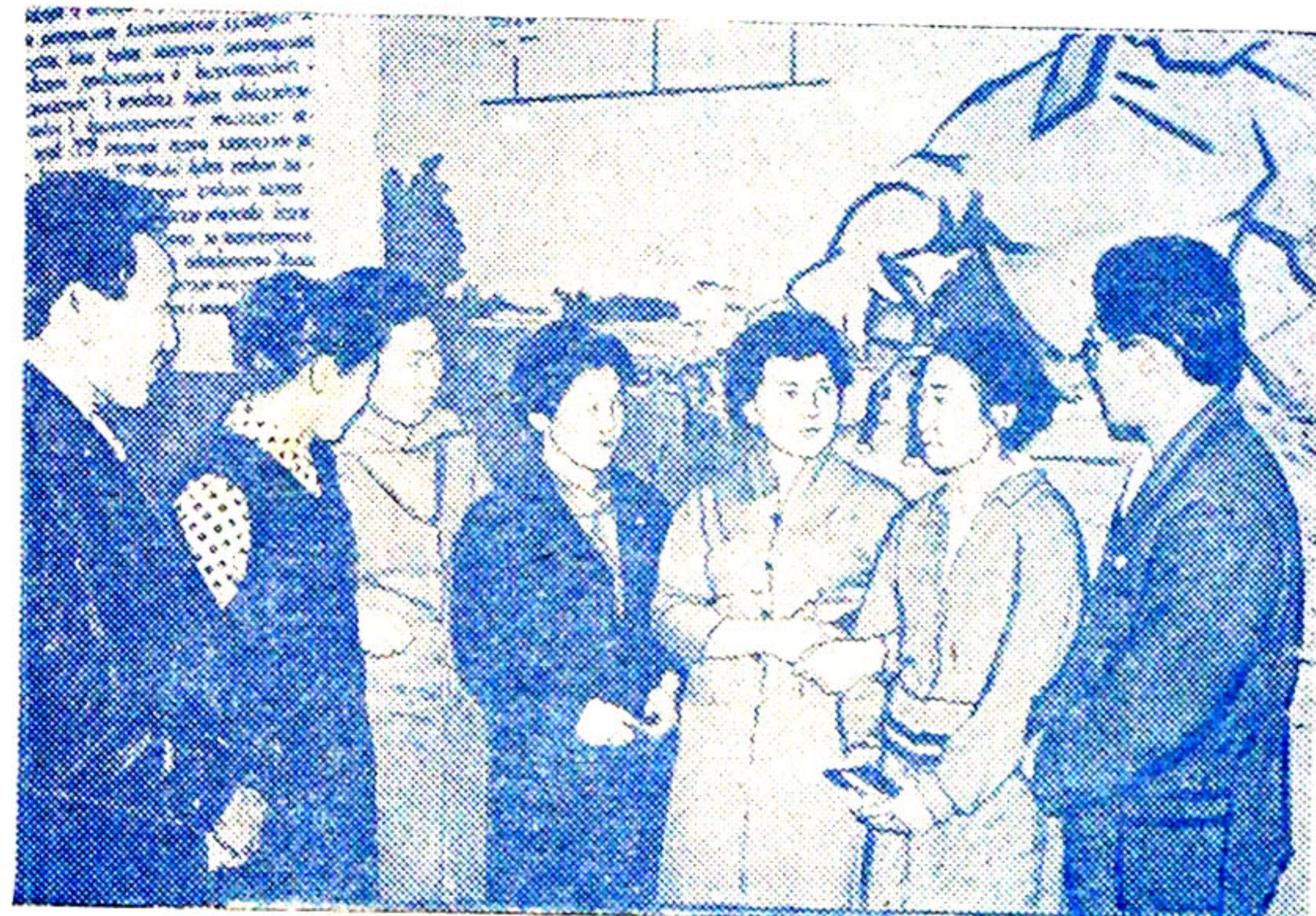
Делегаты конференции беседуют во время перерыва.

Совсем недавно на зональную выставку вузов Дальнего Востока и Сибири в Иркутском политехническом институте в честь 45-летия Октябрьской революции посланы дипломы, проектные, курсовые работы и отдельные статьи, всего — 67 работ. Это первое участие членов НСО на выставке за пре-