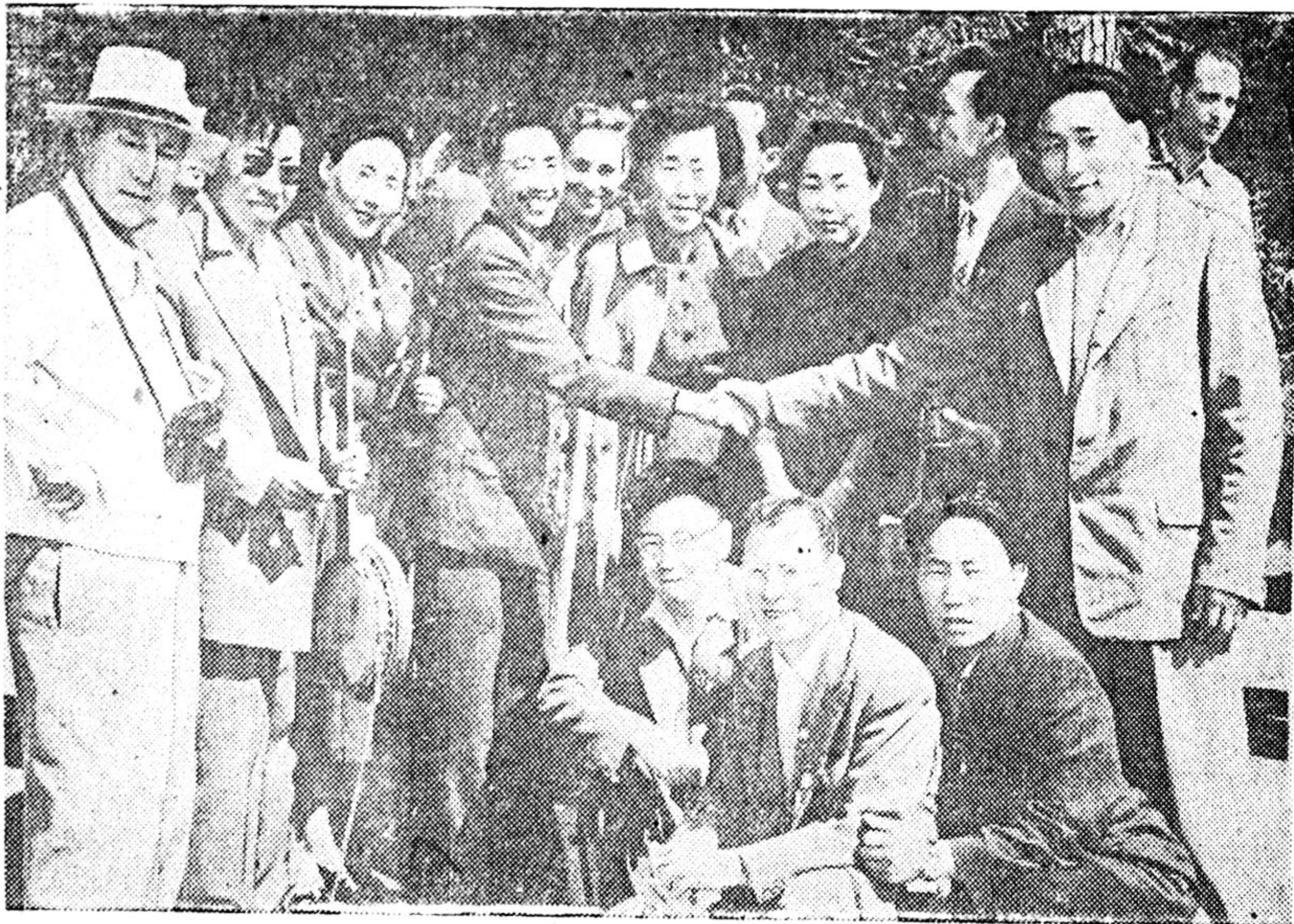
На снимке: туристы Якутии с зарубежными друзьями во время Всемирного фестиваля в г. Москве.

«Якутский университет» 14 марта 1962 года. 3 стр.