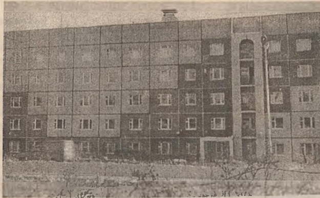
Филиал ЯГУ в г. Нерюнгри

там - все горят желанием научиться на нем играть. После каждого музыкального цикла студенты ПИМНО ставят для своих школьников музыкальные сказки. Сами рисуем декорации, шьем кос-