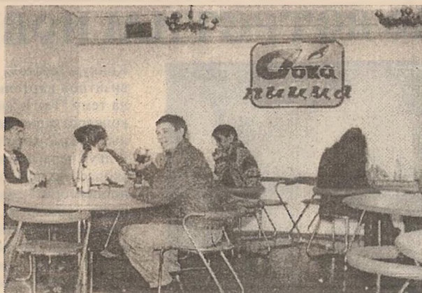
Пиццерия в учебном корпусе

На кафедре нас пятеро. В филиале я работаю второй год, из них 10 месяцев - завкафедрой. Закончил Молдовскую экономическую академию, до приезда в Якутск тоже работал в Кишиневе завкафедрой. Стараемся участвовать во всех городских спортивных мероприятиях. По городу у нас 3 место среди спортивных коллективов. В прошедшем недавно тур-