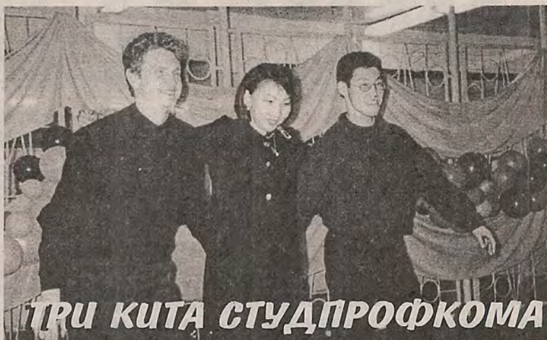
ТРИ КИТА СТУДПРОФКОМА