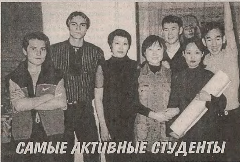
САМЫЕ АКТИВНЫЕ СТУДЕНТЫ