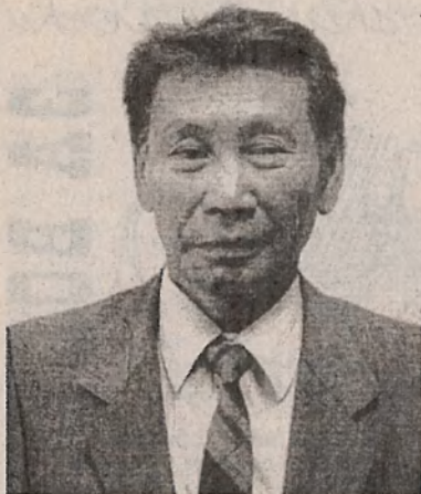
Разговор первый: Что такое выборы

(молодому избирателю об основах российского избирательного права и избирательного процесса)