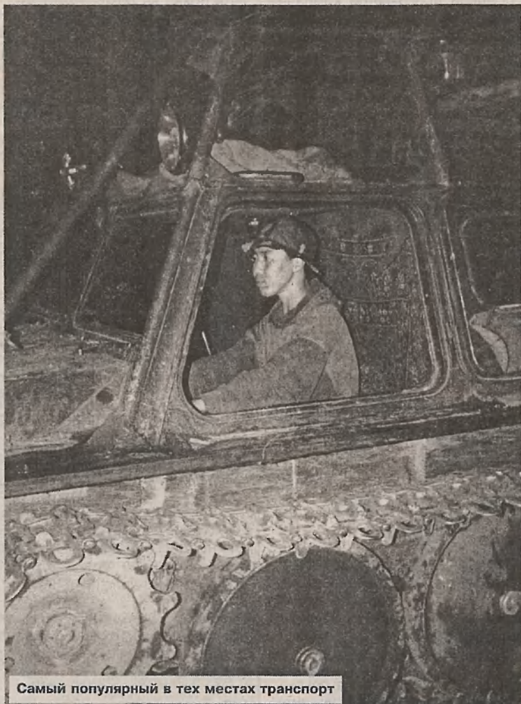
Самый популярный в тех местах транспорт