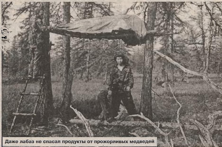
Даже лабаз не спасал продукты от прожорливых медведей

Честно говоря, я ожидал, что мы приедем в место, где несколько изб расположено рядом с лесом, если не в самом лесу.