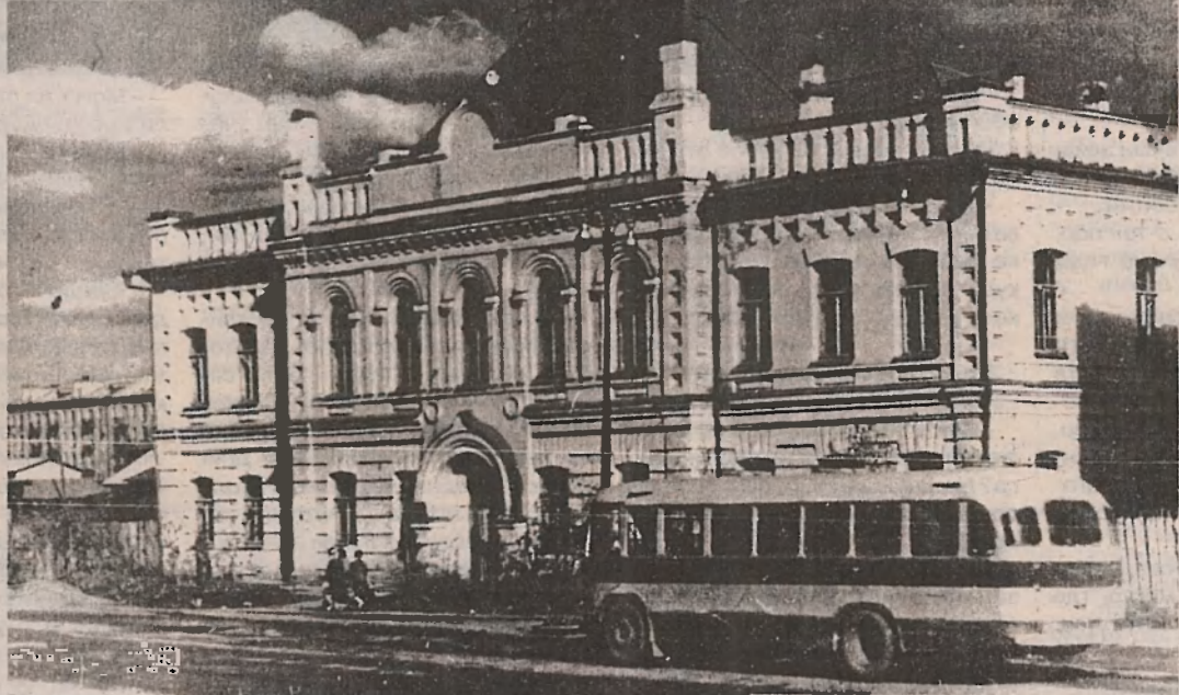
Первое здание университета

ные, прочные и обобщенные. Это и есть единственный путь, ведущий к компетентности специалиста. Обращаясь к будущим учителям, хотел бы подчеркнуть, что педагогическая работа - это один из самых трудных видов человеческой деятельности. Если врач на приеме имеет дело только с одним пациентом, инженер-строитель, в данный момент, только с одним видом стройматериала, то учитель одновременно работает с 25 - 30 учениками с разными характерами и темпераментами, и надо найти к каждому соответствующий подход, позволяющий активизировать его познавательную деятельность. Следовательно, будущим учителям необходимо обратить особое внимание не